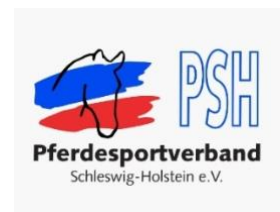
Pferdesportverband Schleswig – Holstein e. V.